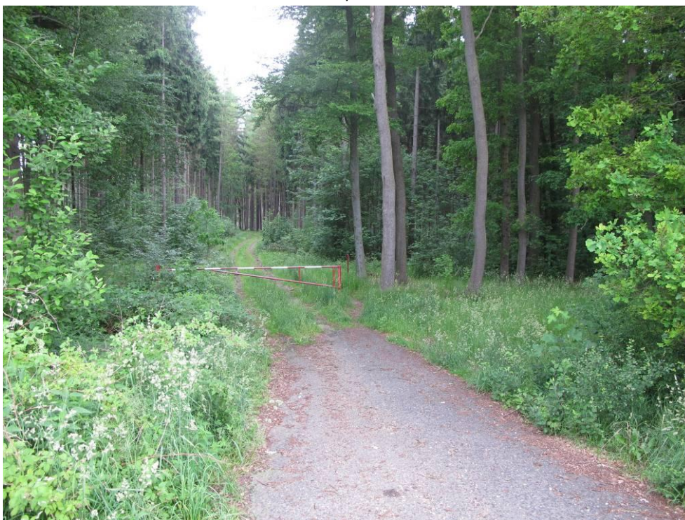
Obrázek č. 8: Přístup 5, lesní cesty