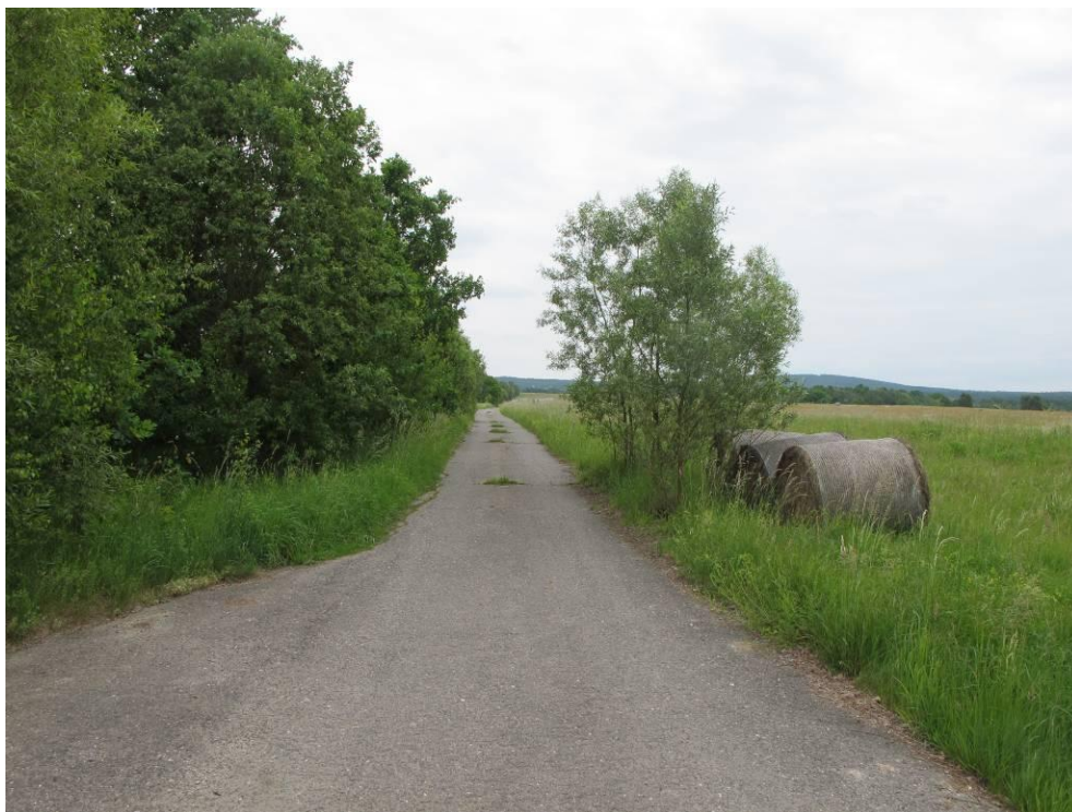
Obrázek č. 19: Přístup 13, cesta Za Celnicí - Nad Mostem