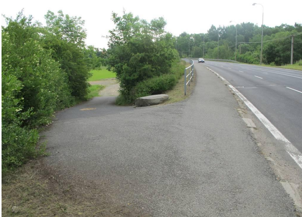
Obrázek č. 1: Přístup 1, Sjezd do zátopy z komunikace II tř. č. 606 –u Pomezí nad Ohří