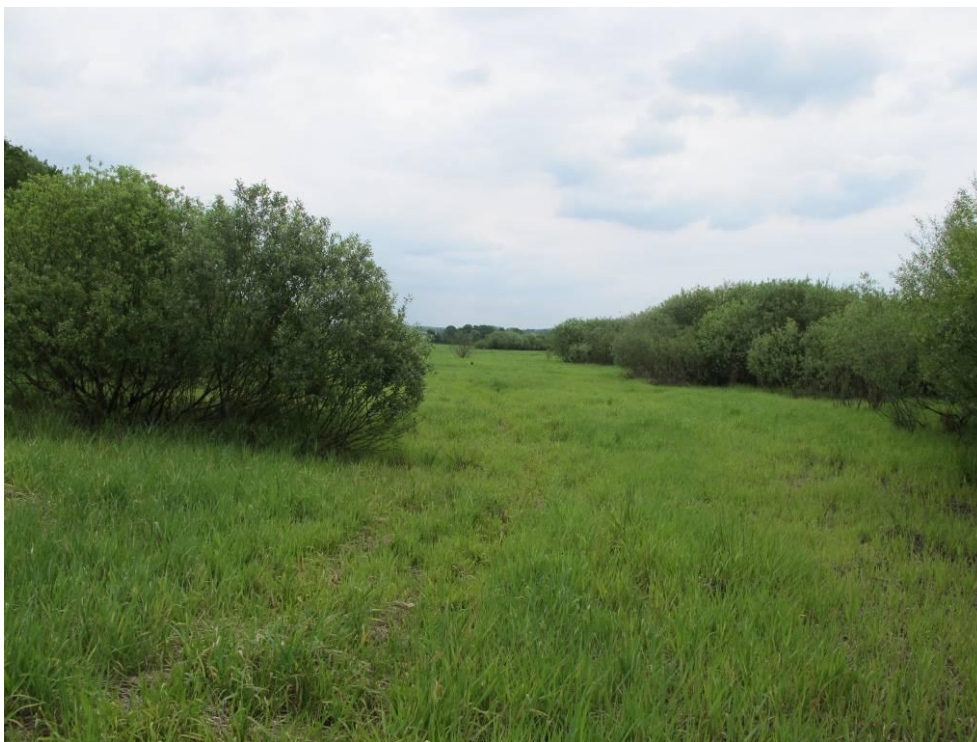
Obrázek č. 17: Přístup 12, porostlé sedimenty v ploše zátopy, Pomezná, začátek přírodní rezervace Rathsam