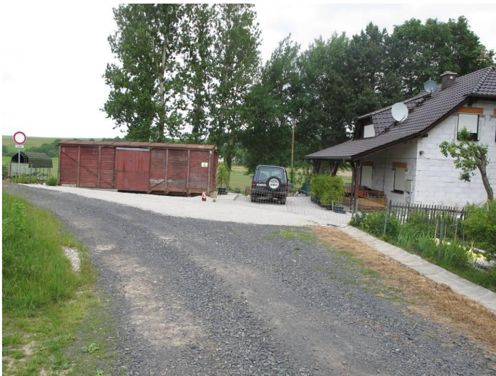
Obrázek č. 5: Přístup 4 lokalita Lesní Mlýn