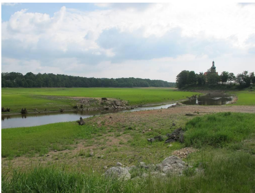
Obrázek č. 2: Přístup 1, zbytky původního mostu u pomezí nad Ohří