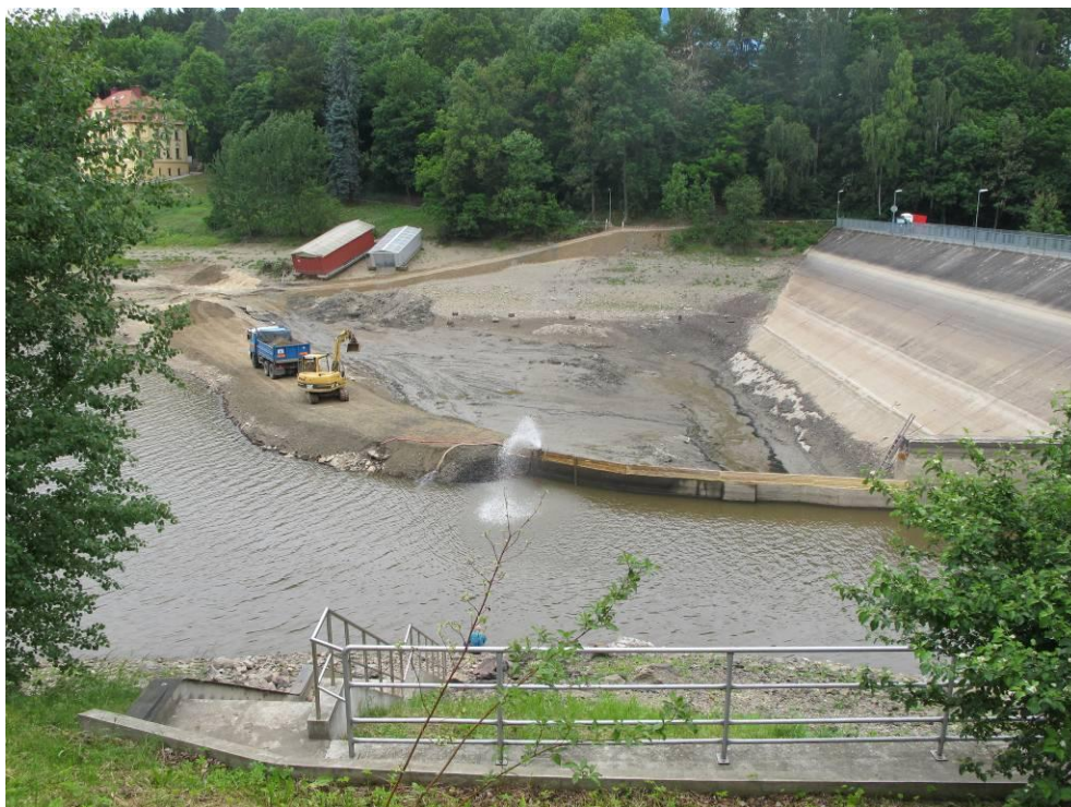
Obrázek č. 21: sjezd do zátopy u přehrady