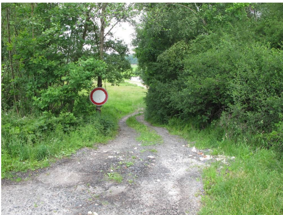
Obrázek č. 4: Přístup 3, Sjezd do zátopy z komunikace II tř. č. 606 – u Pomezí nad Ohří