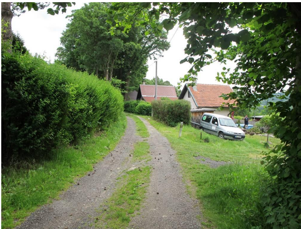
Obrázek č. 15: Přístup 10, Bříza, místní komunikace