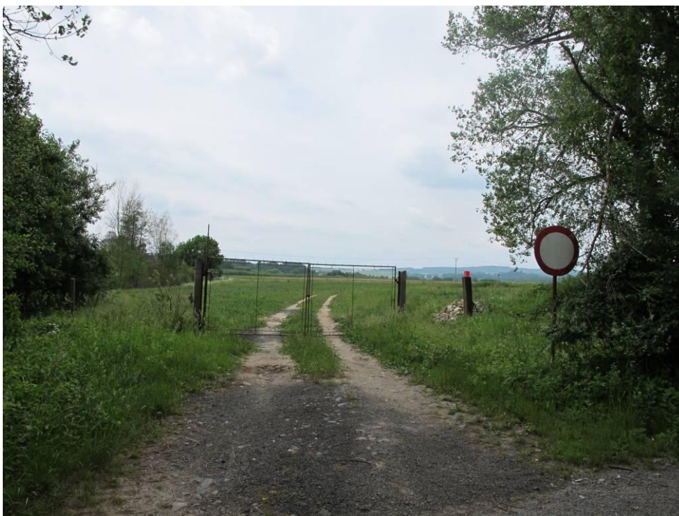
Obrázek č. 16: Přístup 11, sjezd z cesty k Pomezné, přístup do zátopy přes pole