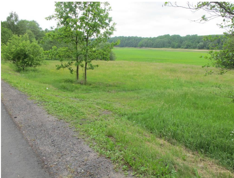
Obrázek č. 3: Přístup 2, Sjezd do zátopy z komunikace II tř. č. 606, přes úsek louky a pláž –u Pomezí nad Ohří