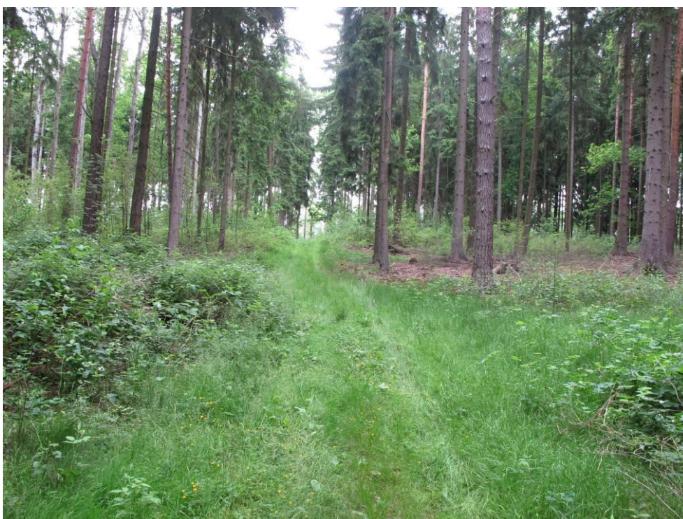
Obrázek č. 12: přístup č. 8, lesní cesta zakončená strmým svahem