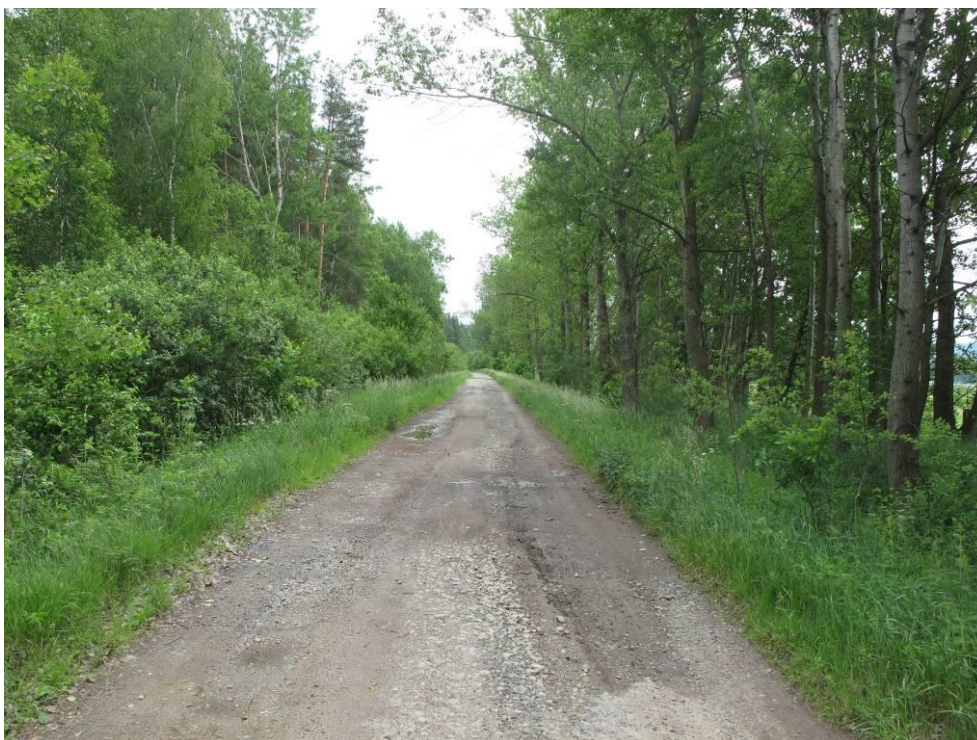
Obrázek č. 18: cesta k Pomezné