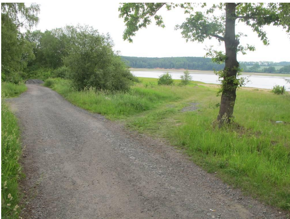
Obrázek č. 9: Přístup 6, Podhoří, cesta podél kempu a chatové oblasti