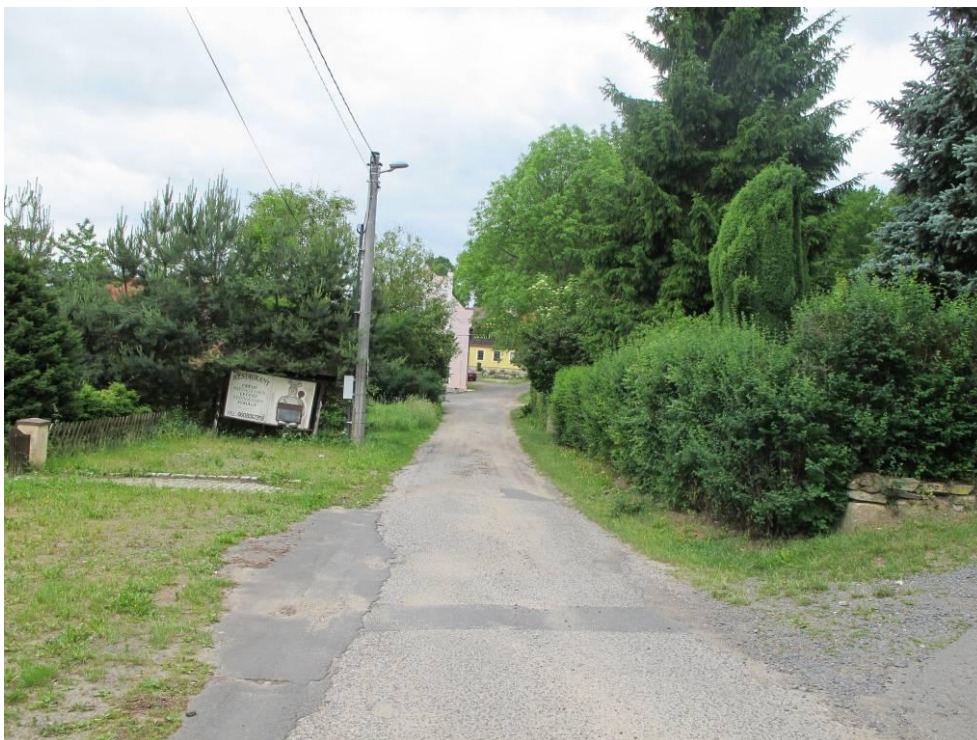
Obrázek č. 13: Přístup 9, místní komunikace Cetnov