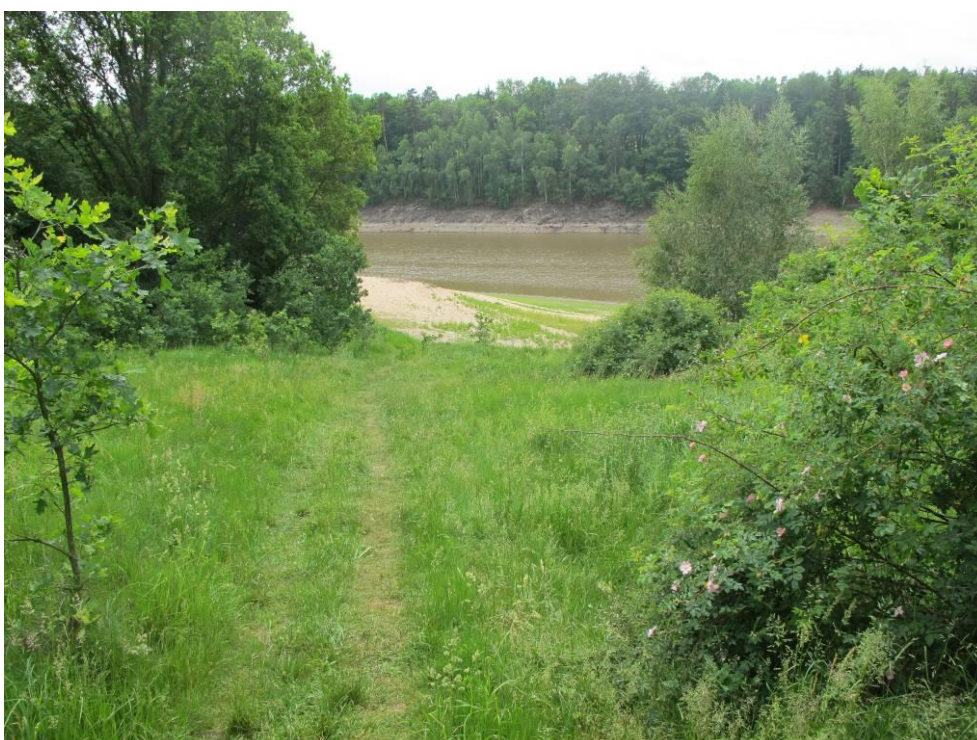
Obrázek č. 10: Přístup 7, strmý přístup Skalka, napojení na místní komunikace přes osadu Skalka