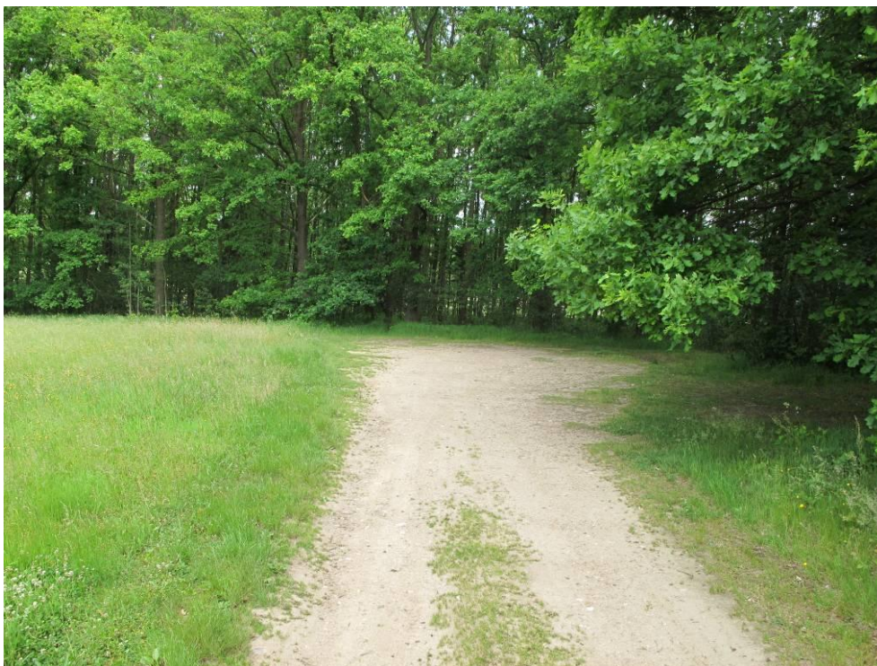
Obrázek č. 7: Přístup 5, lesní cesty