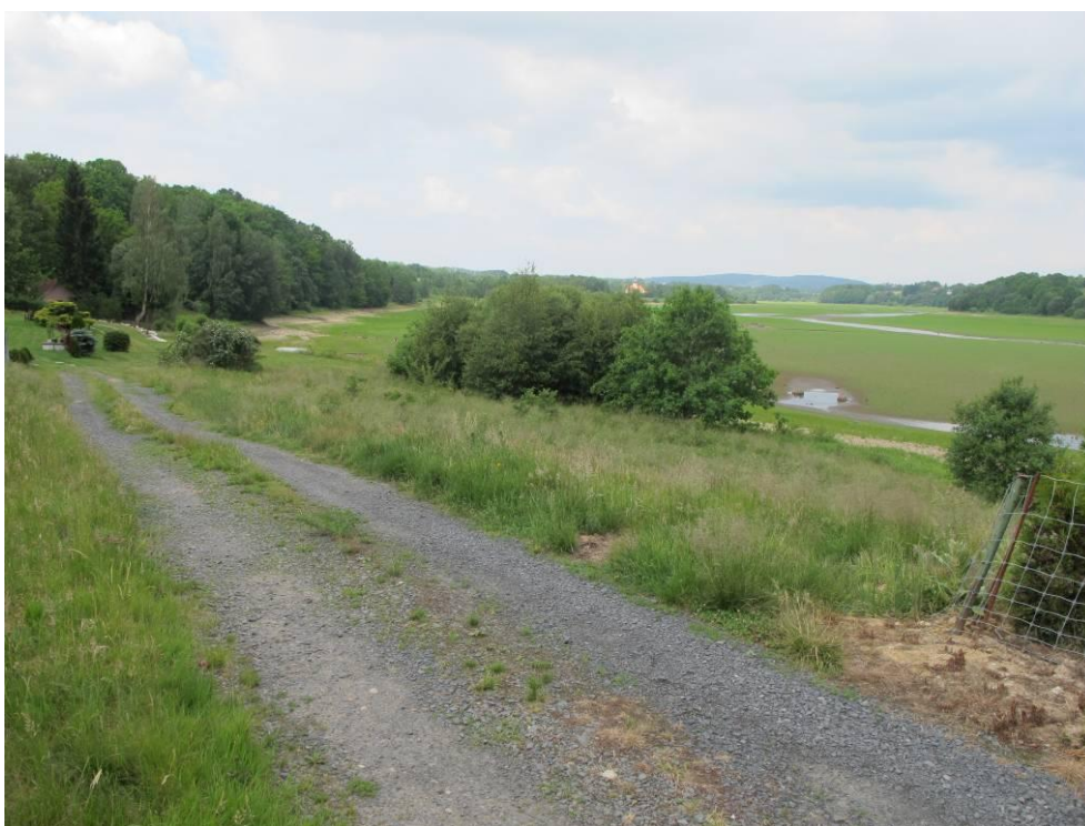
Obrázek č. 6: Přístup 4, příjezd do zátopy