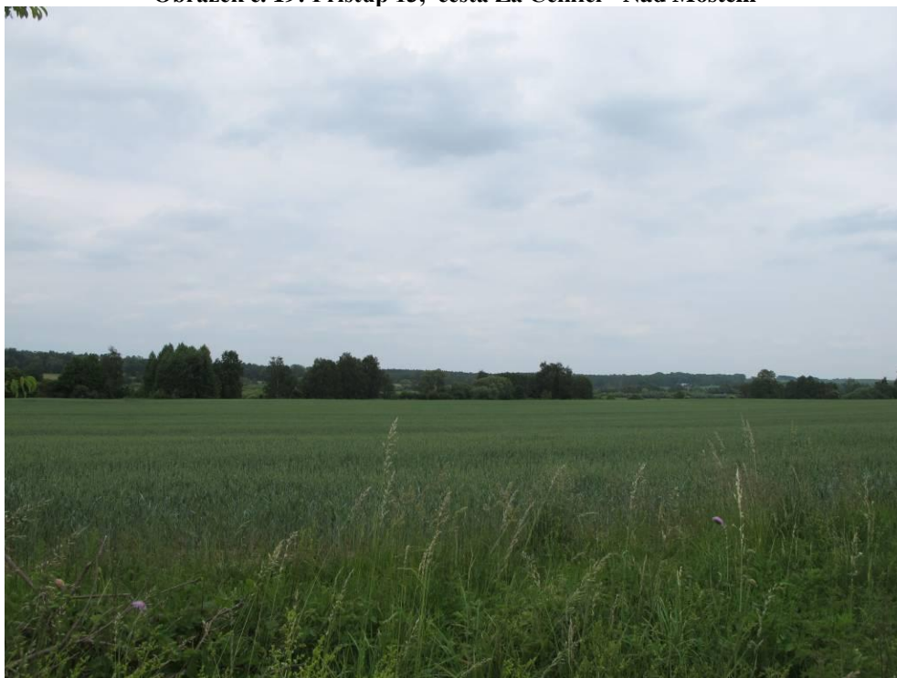
Obrázek č. 20: Přístup 13, přístup do zátopy přes pole