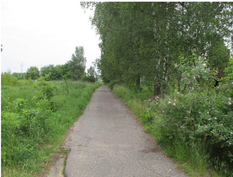
Obrázek č. 11: přístup č. 7, místní komunikace u osady Skalka, podél rekreačních objektů